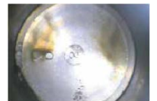
F-1 添加後、300km 走行